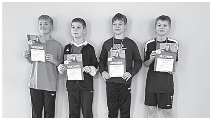
Jungen 11-12 Jahre

Unseren drei Qualifizierten herzlichen Glückwunsch und viel Erfolg beim folgenden Bezirksentscheid.